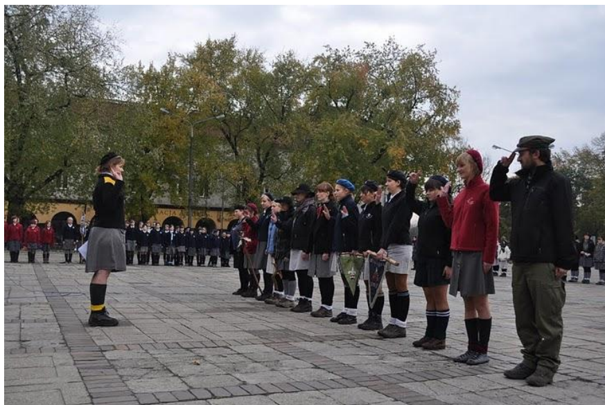
Drużynowe Żółtych Koniczynek oraz przedstawiciele Łódzkiej Chorągwi Harcerek i Łódzkiej Chorągwi Harcerzy składają raport dh obożnej, podczas apelu kończącego ZKK 2010.

Zewsząd słychać było gratulacje, podziękowania i okrzyki składane kadrze, szefowym grup zadaniowych, przybyłym drużynom i poszczególnym zwycięzcom zlotu.