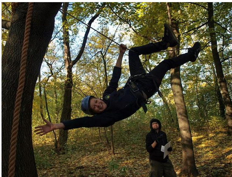
Zadanie związane z poruszaniem się po linach, zjazdem linowym itp.

Wszystkie patrole spotkały się ostatecznie w jednym punkcie, gdzie czekało je ich ostatnie wspólne zadanie- budowa mostu! Tak, tak- zadaniem było zbudowanie prawdziwego mostu, nad jednym z łągiennickich strumyków. Nie było to łatwe, każdy patrol mógł wykonać tylko ściśle określone zadanie i użyć jedynie przydzielonych mu do tego narzędzi. Jedne uczestniczki nosiły, inne ciosały i piłowały, kolejne wiązały, a jeszcze inne pilnowały zgodności budowy z planem. Nad wszystkim co działo się na placu budowy czuwali inspektorzy BHP i kierownicy budowy, czyli przybyłe ze swojego porannego wyczynu, drużynowe.