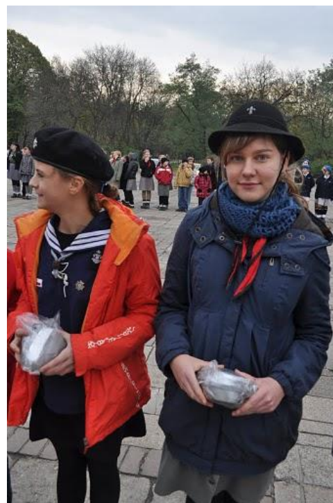
Członkinie jednego ze zwycięskich patroli podczas gry miejskiej