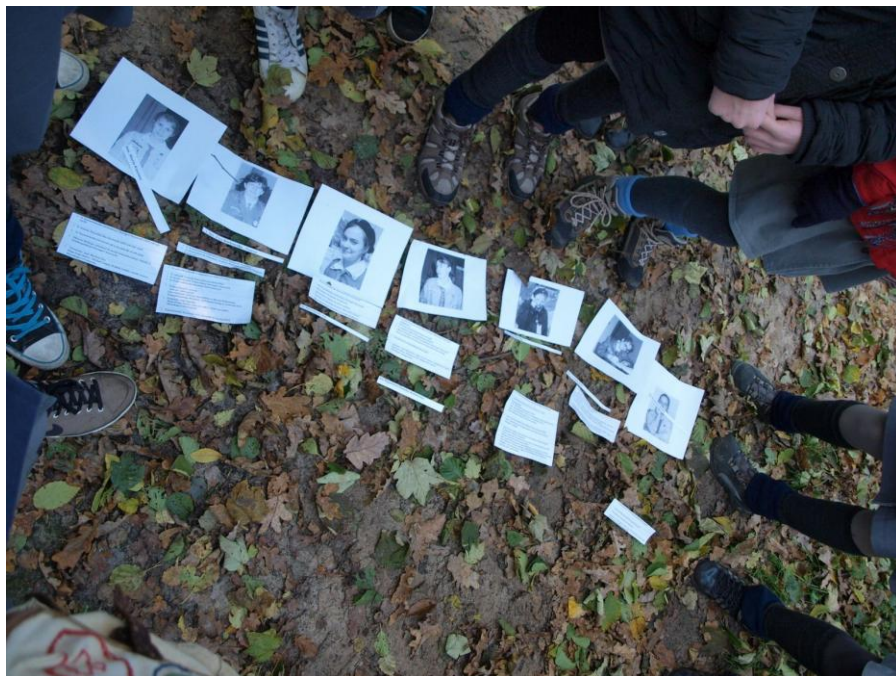
Zadanie dotyczące znajomości historii Organizacji Harcerek w tym znajomości naczelniczek OH w ZHR.

Następny dzień przybył niespodziewanie szybko. Już o świcie, po smacowym śniadaniu ubogaconym o wspaniałe złote sałatki, rozpoczęły się przygotowania do gry leśnej. Godzina 8.10 wyjazd autobusami na grę, godzina 8.30 start gry! Uczestniczki znalazły się w Lesie Łągiennickim, czyli największym w Europie miejskim kompleksie leśnym...oj było gdzie biegać! Ten olbrzymi teren lasów miejskich, wspaniałe miejsce do dużych gier terenowych, pomieściło na ponad 20 punktach wszystkie złote patrole. Uczestniczki wzięły udział w leśnej grze terenowej pt. „Łącząc mostem”. Podczas niej harcerki mogły sprawdzić swoje umiejętności w harcerskich technikach, wiedzę i pomysłowość oraz zgranie w patrolach, lecz to nie wszystko. W toku gry poznawały także tajniki budowy mostu.