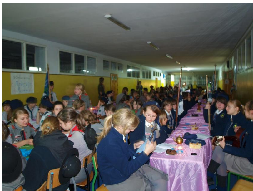
Drużyny podczas spotkania w atmosferze herbacianej zadumy.

Po apelu rozpoczynającym powróciliśmy do szkoły, by wspólnie spotkać się przy herbacie i ciastku w atmosferze jednej z łódzkich herbaciarni o nazwie „Niebieskie Migdały”.